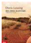
(Belarra kantari, Elkar, 2008)

Morroiak besaburuak goratu, irribarre egin eta begiak zerura jarrita zegoen, protesta eginez bezala, Maryk lehendabizi bere hizkuntzan egitea eta ondoren Maryrenean egitea debekatu ziolako: orduan, nola hitz egin behar zuen? Herabetasunik gabeko lotsagabekeria hark ezin esaneko errabia eragin zion Maryri. Ahoa zabaldu zuen morroiari sekulakoak esateko, baina tutik esan gabe jarraitu zuen. Erresumin iluna ikusi zuen gizonaren begietan, eta –huraxe izan zen azkeneko tantoa– mespretxu jostagarria. Eta Maryk, zer ari zen ohartu ere gabe, zartailua jaso eta aurpegian jo zuen, zartako bihurri gaizto batekin. Zer ari zen ez zekien. Geldi-geldi geratu zen, dardarka; eta ikusi zuenean gizona erdi tontotuta eskua aurpegira eramaten, Maryk txundituta begiratu zion eskuan zeukan zartailuari, bere kabuz mugitu balitz bezala, berak nahi gabe.